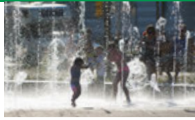
Bürgerpark Haltestelle Stadthalle