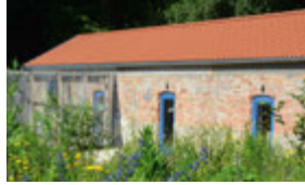
Umweltbildungszentrum Listhof, Haltestelle Roßwasen