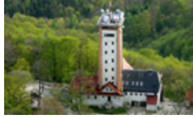
Rossbergturm Haltestelle Tulpenplatz