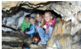
Nebelhöhle Haltestelle Nebelhöhle