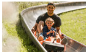
Sommerbobbahn Haltestelle Marktplace