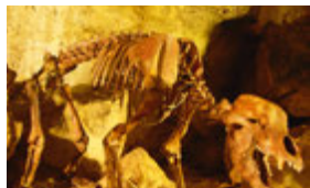
Bärenhöhle Haltestelle Bärenhöhle/ Traumland